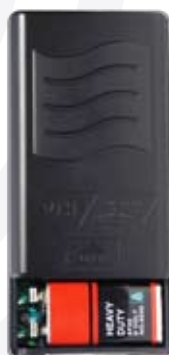
Esempio di inserimento batteria nel lavalier del mod. SET 6070LAV

Una volta completati questi passaggi siete pronti per utilizzare il vostro nuovo apparecchio.