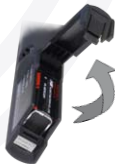
Esempio di inserimento batteria nel palmare del mod. SET 6070