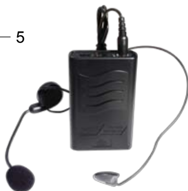
Microfono lavalier SET 6070LAV