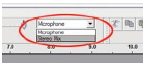
FIG 1 - Selezionare Stereo Mix

2) Selezionare il menù “Modifica” e poi “Preferenze”.