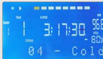
Particolare del display