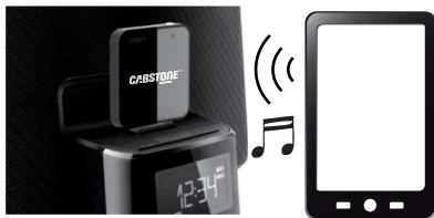
Fig. 2: Anschließen und Bedienen

Der 30PIN DOCK-Stecker kann sowohl analoge als auch digitale Daten übertragen, Ihr DockingStreamer nur analoge.