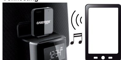
Fig. 2: Connecting and Operating

The 30PIN DOCK plug transmits both, analog and digital data, your DockingStreamer only analog data.